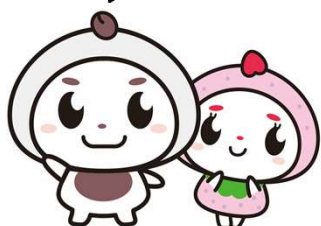
だいふくん いちごちゃん